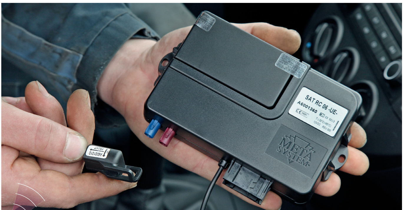
Bild 1 | Klein, schwarz und nach der Montage im Auto nicht zu sehen – das ist die Technischeinheit des Copiloten. Links der Crash-Sensor, der beim Unfall die Beschleunigungskräfte erfasst.

Bei Unfällen mit Personenschäden ist eine schnelle Alarmierung der Rettungskräfte, vor allem aber eine genaue Lokalisierung des Unfallortes notwendig. Der Copilot zielt damit in erster Linie auf Hilfe in Situationen, in denen die Betroffenen nicht mehr selbst reagieren können. Ebenso kann niemand den Unfall bemerkt haben. Auch Unfallzeugen sind oft – so eine Erfahrung der Rettungsdienste – nicht in der Lage, exakte Angaben zum Unfallort ▶