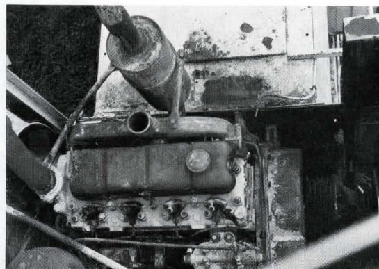
Bild 2. Brandausbruch am Motor eines Mähdreschers durch Entzündung von Getreidestaub am überhitzten Auspuff.

Masch.-Ing. (grad.) Wolfgang Winzenburg, Mitarb. d. Techn. Abt. d. Schleswig-Holsteinischen Landesbrandkasse.