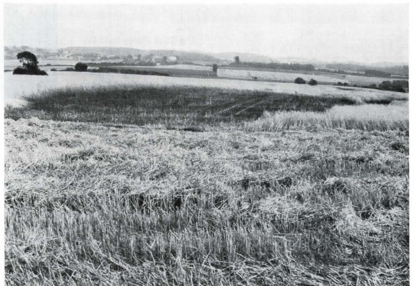
Bild 7. Hier verbrannte ca. 1 ha Getreide, ausgelöst durch einen Mähdrescherbrand.

Die Versicherer sollten dieses Ziel durch Verhandlungen mit den Herstellern und Importeuren auf Verbandsebene zu erreichen versuchen.