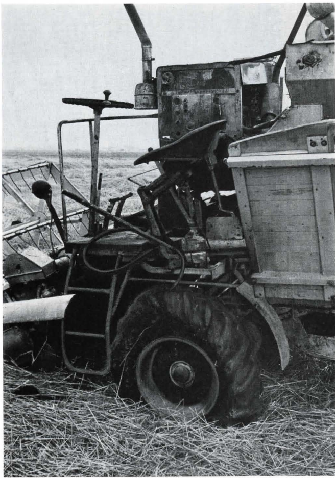
Bild 6. Bei diesem Mähdrescher griff das Feuer auf die Bereifung über und verursachte einen Flächenbrand auf dem Getreidefeld.

pen dichtsetzen, so daß eine ausreichende Kühlung des Motors nicht mehr gewährleistet ist. Dies kann leicht zu einem Brande führen.