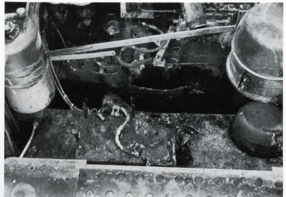
Bild 5. Die Zerstörungen am Motor zeigen, wie hoch die Temperaturen bei Mähdrescherbränden liegen. (Starke Anschmelzungen an den Metallteilen.)

in landwirtschaftlichen Gebäuden bleibt hierbei unberücksichtigt.