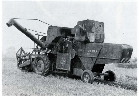
Bild 1. Mähdrescher, der durch rutschenden Keilriemen in Brand geriet. Zerstörungen an Motor und Antriebsteilen.

Hier soll nur auf die Mähdrescherbrände eingegangen werden, die durch den Betrieb der Maschinen entstanden sind. Die Zerstörung von Mähdreschern als Folge von Bränden