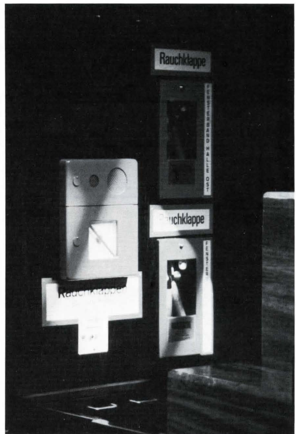
Bild 2. Brandschutzeinrichtungen sollen für jeden gut sichtbar an der Rezeption installiert sein, hier in der Empfangshalle eines internationalen Hotels in Berlin.

wenn die geschilderte Abluftanlage während des Brandes weiterläuft.