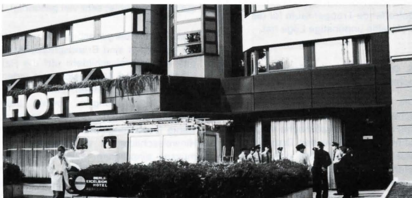
Bild 4. Ortsbesichtigungen durch die Löschmannschaften der öffentlichen Feuerwehr sind ein wesentlicher Teil der Einsatzvorbereitung.

die akustischen Alarmzeichen, die zur Räumung des Gebäudes auffordern, beschreiben (Bild 3).