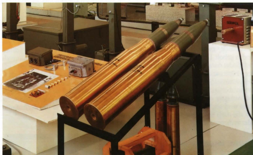
100 mm-Panzergranaten (Panzergranaten befinden sich bereits in der Entsorgung)

Zur Beschreibung des technischen Zustandes wurde die Munition von der