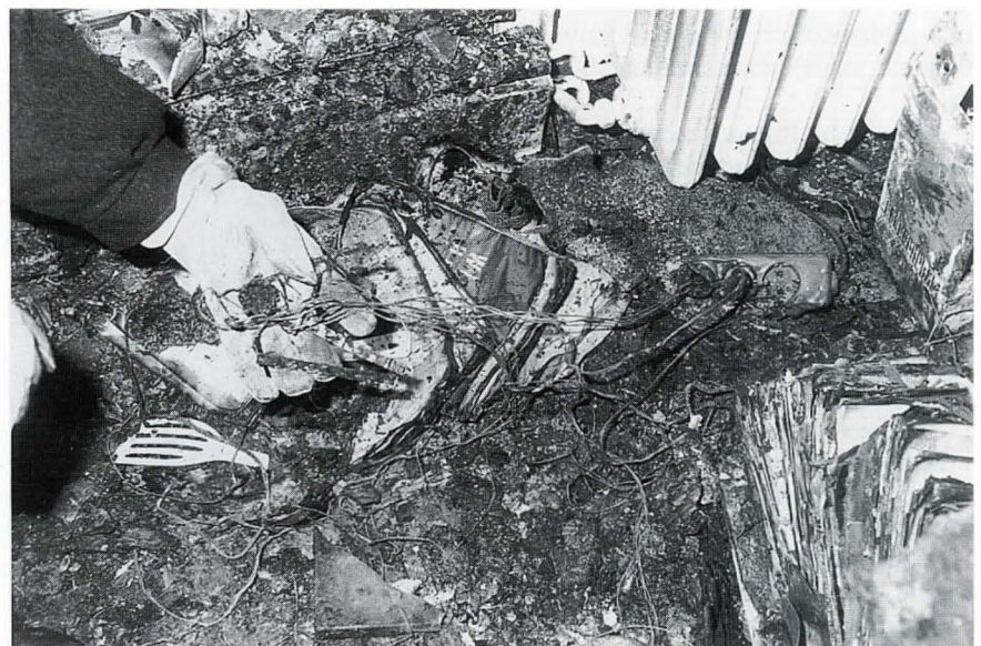
Bild 6: Dreifachsteckdose die mit einer weiteren Dreifachsteckdose verbunden ist. Die Überlastung und die damit verbundene Temperaturentwicklung führten zum Brand

Immer wieder zeigen sich bei der Brandortaufnahme beim Verdacht eines technischen Defektes geradezu abenteuerliche Kabelverbindungen in Mehrfachsteckdosen. Je nach Leitungsquerschnitt sind Mehrfachsteckdosen jedoch nur für eine bestimmte Leistung zugelassen. An diversen Brandorten fanden sich nun Mehrfachsteckdosen, die ihrerseits selbst in weitere Mehrfachsteckdosen eingesteckt waren, um damit mehr Verbraucher anschließen zu können