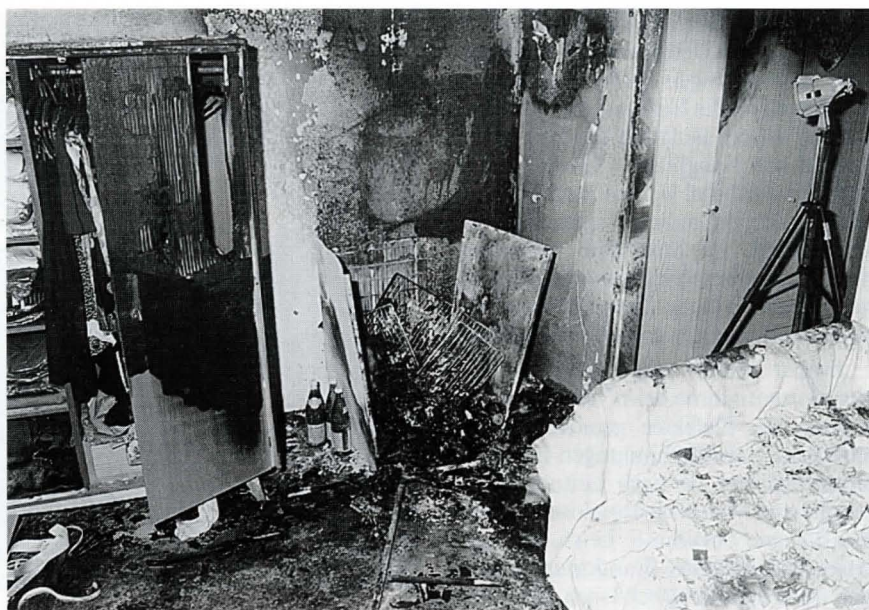
Bild 2: Brandursache – technischer Defekt eines Kühlschranks. Die Bewohnerin des Zimmers erlag den schweren Brandverletzungen.