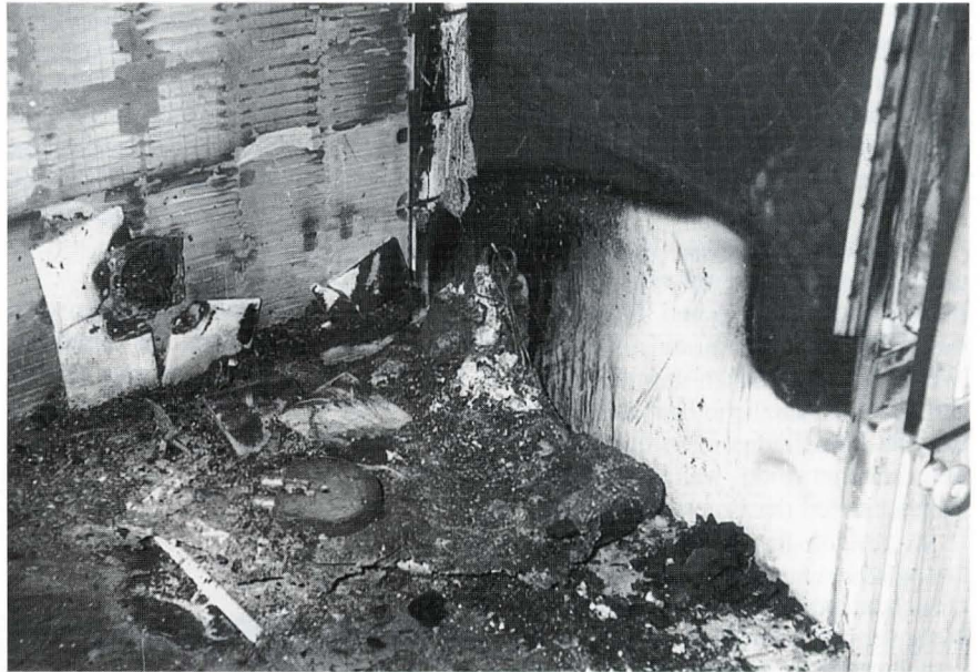
Bild 3: Aufnahme des Brandausgangsortes mit erkennbaren Resten einer Kaffeemaschine

Häufig sind dabei aber nicht die Geräte selbst die Ursache des Brandes sondern deren elektrische Zuleitungen. Es zeigt sich immer wieder, daß Elektrokabel unsachgemäß verlegt sind bzw. auf den Kabeln schwere Gegenstände wie Schränke, Tischbeine o. a. stehen.