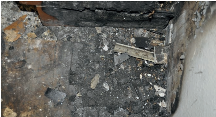
Die Durchbrennung im Parkett

Kurz bevor er sie an den Eigentümer übergeben sollte, betrat ein Mieter seine alte Wohnung und fand die Räume stark verraucht vor. Er sah einen Glimmbrand auf dem Fußboden der offenen Küche und rief die Feuerwehr. Beim Löschen mussten die Einsatzkräfte die Kücheneinrichtung bewegen und zum Teil nach draußen tragen. Dennoch konnte der IFS-Gutachter, der mit der Ermittlung der Schadenursache beauftragt wurde, das Spurenbild klar erkennen: Rechts neben dem Platz, an dem zuvor der Kühlschrank gestanden hatte, gab es eine Durchbrennung im Parkett. Auch die Fußleiste aus Holz war hier weggebrannt. An dieser Stelle war das Schadenfeuer entstanden.