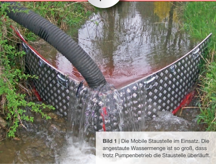
Bild 1 | Die Mobile Staustelle im Einsatz. Die angestaute Wassermenge ist so groß, dass trotz Pumpenbetrieb die Staustelle überläuft.