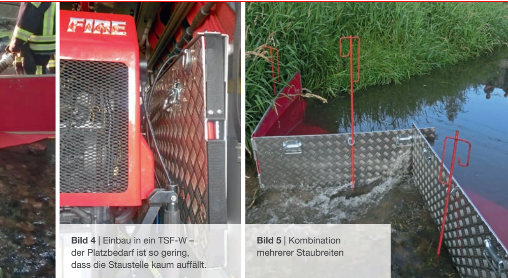
Bild 4 | Einbau in ein TSF-W – der Platzbedarf ist so gering, dass die Staustelle kaum auffällt.