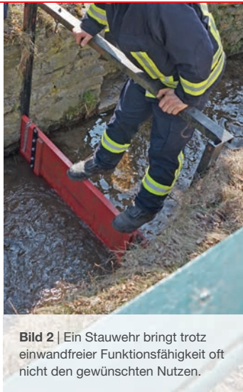
Bild 2 | Ein Stauwehr bringt trotz einwandfreier Funktionsfähigkeit oft nicht den gewünschten Nutzen.